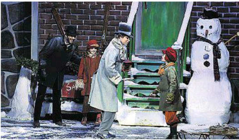
Décembre est un spectacle magnifique qui permet de s'abandonner dans la magie de Noël.