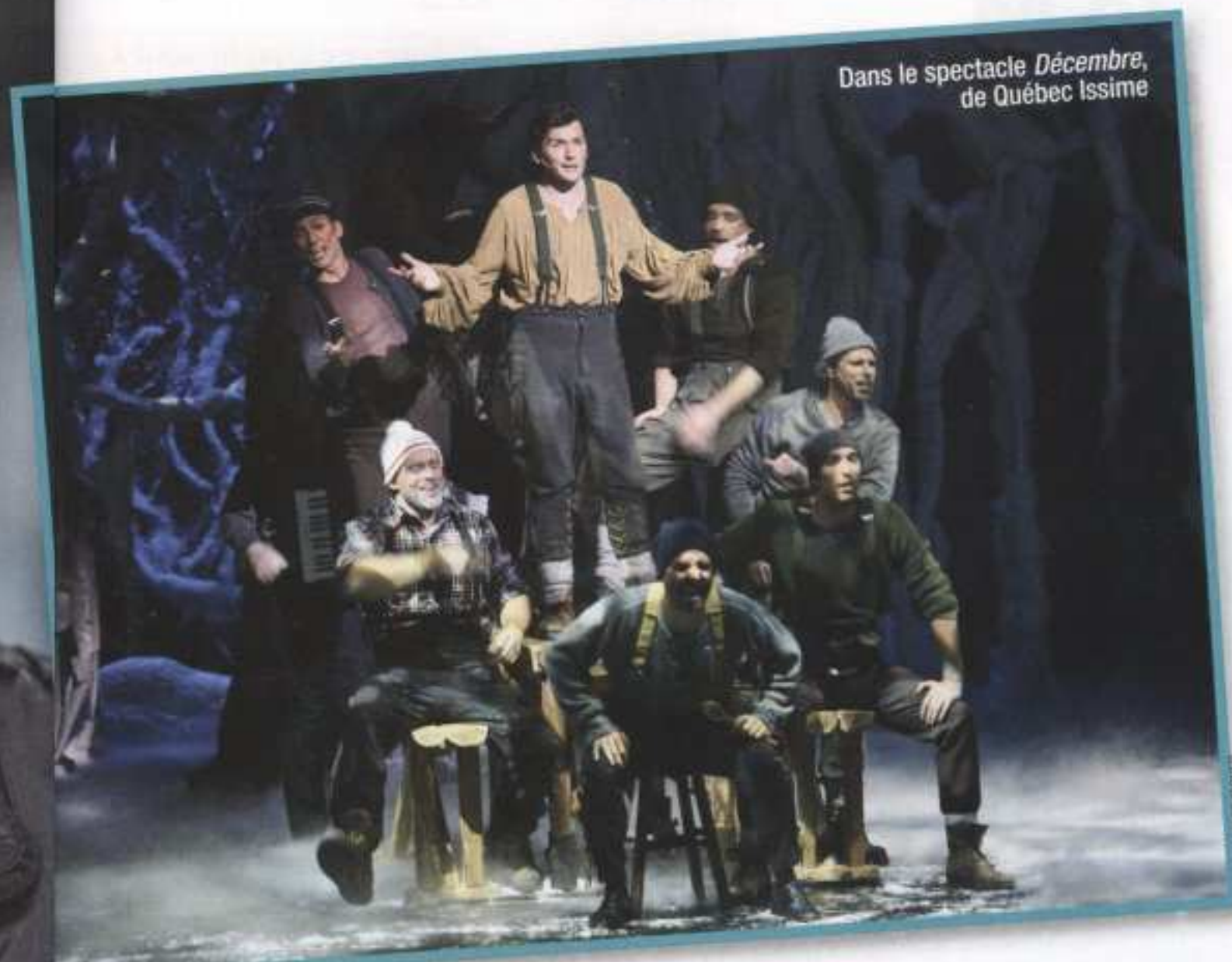
Dans le spectacle Décembre , de Québec Issime